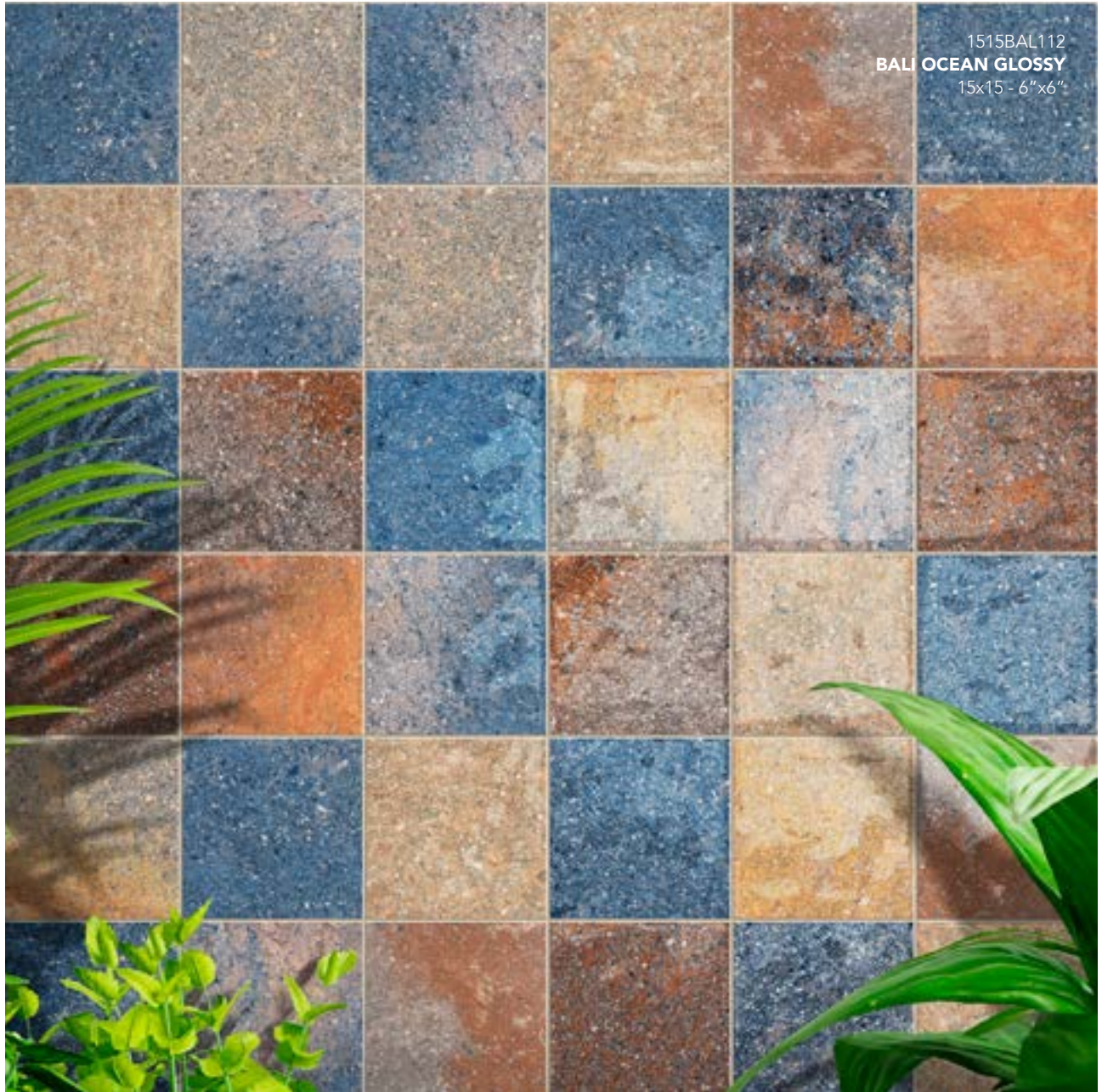
1515BAL112 BALI OCEAN GLOSSY 15x15 - 6"x6"